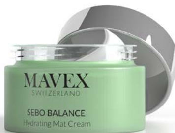
09-005 Hydrating Mat Cream 50 ml

Avec antibactérien. Nettoie efficacement en éliminant toutes les impuretés.