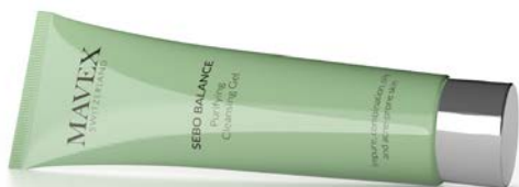
09-001 Purifying Cleansing Gel 150 ml

ILS SONT INDISPENSABLES POUR AMELIORER LES EFFETS DU TRAITEMENT EN CABINE